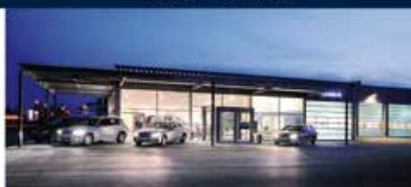
Autohaus Mack Illertissen

Frankfurt-Lair Str. 9 Tel. 0 73 07 94 94 - 0 www.autohaus-mack.de Öffnungszeiten: Mo-Fr: 9.00 - 18.00 Uhr Sa: 8.00 - 14.00 Uhr